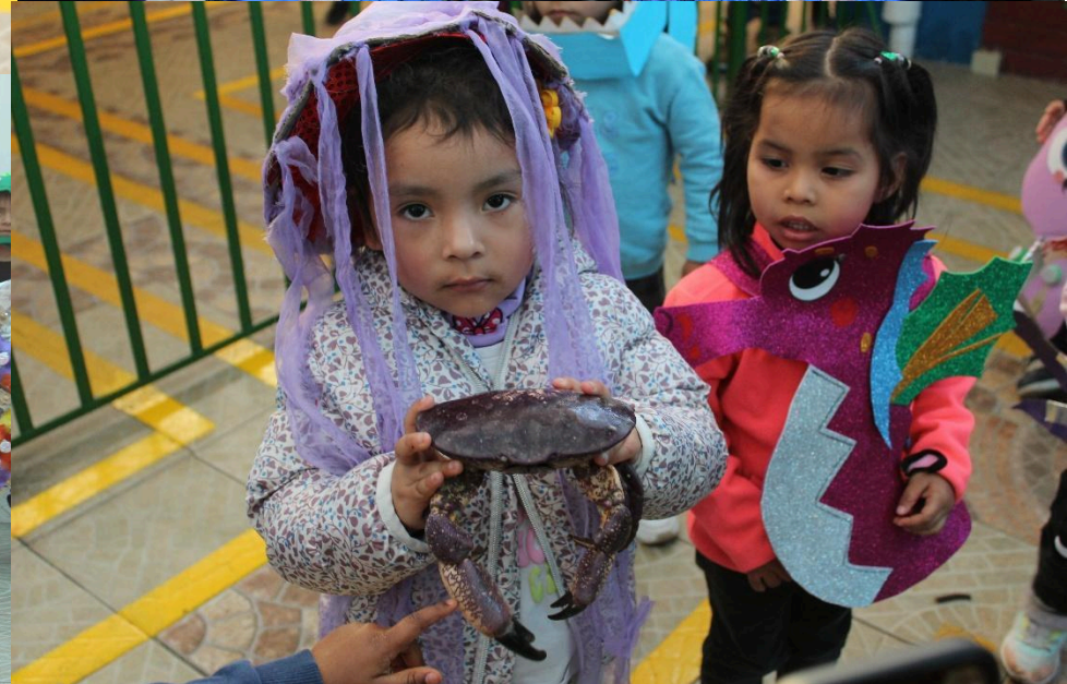
MAYO CIERRE DE UNIDAD TEMÁTICA