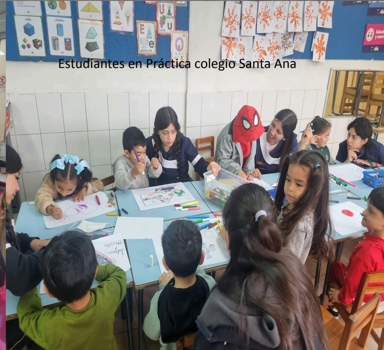
Estudiantes en Práctica colegio Santa Ana