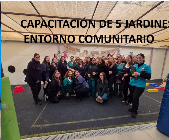
CAPACITACIÓN DE 5 JARDINES ENTORNO COMUNITARIO